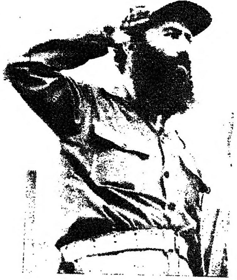
قائد الحرس الثوري الإسلامي أبو شريف يؤدي التحية لآسراد الحرس الثوري خارج جدران السفارة الأميركية في طهران.

طهران - وكالات - ذكرت وكالة الأنباء الإيرانية ان قائد الحرس الثوري الإسلامي الإيراني السيد عباس زنجاني ( أبو شريف ) قدم استقالته اول امس بسبب الانتقادات التي وجهت ضد أعمال الحرس الثوري - لكن المناطق بلسان الرئيس أبو الحسن بني صدر المفاد الأعلى للصوت المسلحة صرح بان الاستقالة لم تقبل بعد ولا يعلم اذا كانت ستقبل.